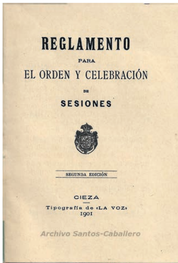
Primera página del reglamento.

El primer capítulo, titulado: De las sesiones del Ayuntamiento, nos habla, en los primeros cuatro artículos que contiene, de la convocatoria de las sesiones ordinarias y extraordinarias y las multas de cinco pesetas que se impondrían al alcalde, tenientes y regidores que no acudieran sin causa justificada. Las reuniones, de dos horas de duración, serían públicas salvo si se acordaba por la mayoría que fueran secretas. Los concejales debían asistir “con traje decente, arreglado a su clase”, así como a los actos públicos.