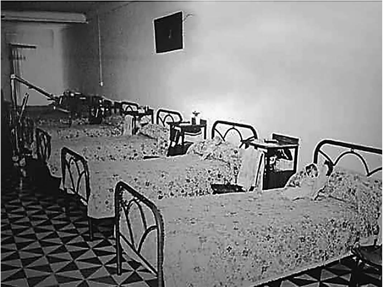
Sala de la maternidad de Cieza

Estaba acreditada para ello antes de crearse la Maternidad, aunque fue precisamente en 1949 cuando es ratificada en su puesto, tal como lo atestigua el BOE, publicando el concurso de antigüedad convocado un año antes para provisión de personal en la plantilla del Cuerpo de Matronas de Asistencia Pública Domiciliaria, adjudicando en propiedad plazas en este servicio. En ese momento su hoja de servicios era de 5 años, 4 meses y