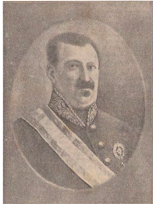
Don Domingo Forcadell Comandante General de los carlistas valencianos desde 1837 hasta 1840

De Yecla, Domingo Forcadell pasaría a Abanilla, población indefensa en la que entraron en la noche del 28 de marzo. El comandante general de Murcia, Pedro Chacón, intentó salir a su encuentro con cuatro compañías de Nacionales, pero tras un primer choque con las tropas carlistas en el que estas hicieron prisioneros a tres miembros de la caballería de la avanzada, embistiendo después a la infantería situada en Abanilla, que consiguió retirarse en orden gracias al apoyo de la caballería, se replegó a Monteagudo, desde donde se limitó a observar al enemigo. Allí tuvieron noticia de que Forcadell se dirigía a Orihuela y conocieron que sus hombres habían asesinado en su camino a los tres nacionales de caballería que habían hecho prisioneros y a los dos carabineros capturados en el lance de Abanilla, todos ellos