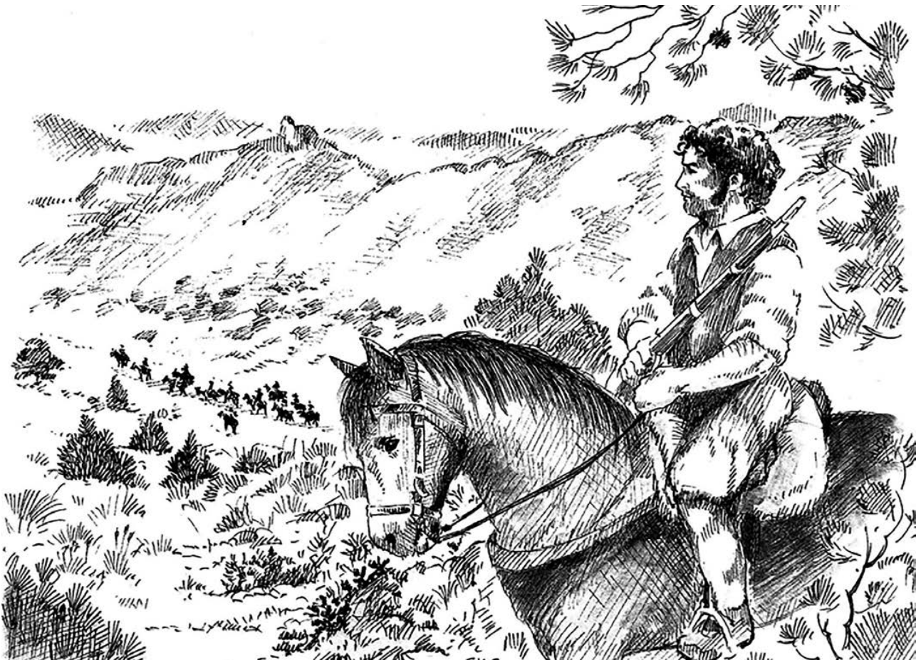
El Peliciego en las proximidades de Jumilla.

Los peritos valorarían los daños y perjuicios causados en la bodega en 1.436 reales, acordando el Ayuntamiento indemnizar al propietario con esa cantidad en base al bando publicado por el Jefe político el 17 de mayo anterior. Los componentes del Ayuntamiento de Jumilla lo justificaron en que de ese modo la facción no podía destruir la fortuna de ningún particular que fuese enemigo suyo y veían que cuando querían dañar